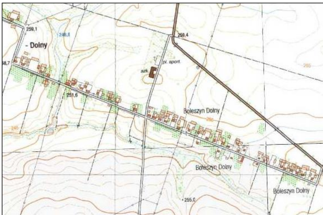
Rysunek 4. Boleszyn Dolny - charakterystyczny przykład tradycyjnej ulicowej zabudowy wiejskiej na terenie Gminy Waśniów.

Nie mniej ważnym elementem krajobrazu kulturowego Gminy Waśniów są zachowane ziemiańskie siedliska dworów wraz z folwarkami i parkami przydworskimi takie jak: Boksyce, Garbacz, Czajęcice, Grzegorzowice, Kunin, Nagorzyce, Mirogonowice, Sarnia Zwola, Wronów. Te zabytkowe zespoły zostały ukształtowane w pełnej koegzystencji z układami ruralistycznymi stanowiąc ich integralną część. Chociaż wyniku przemian ustrojowych w poł. XX w. grunty rolnicze dworów uległy parcelacji, ocalały parki podworskie o charakterze krajobrazowym ukształtowane w XVIII – XIX w. Ich układy przestrzenne w większości wpisują się podziały katastralne wiosek zachowując formę zbliżoną do regularnych prostokątów jak np. parki w Boksycach, Garbacz, Grzegorzowicach, Kuninie, Mirogonowicach i Wronowie. (vide: karty adresowe zabytków Gminy Waśniów) Pozostałe: w Czajęcicach, Nagorzycach, i Sarniej Zwoli, swój nieregularny układ zawdzięczają zróżnicowanemu ukształtowaniu terenu w połączeniu z naturalnymi ciekami wodnymi wykorzystanymi do uformowania sztucznych oczek wodnych, sadzawek wzbogacających walory krajobrazowe (n.p. Sarnia Zwola) W parkach podworskich zachowało się kilka budynków dworskich będących atrakcją turystyczną Gminy (Boksyce, Czajęcice, Kunin, Wronów) Inne zostały odbudowane od podstaw (Garbacz, Mirogonowice) lub przebudowane (Nagorzyce).