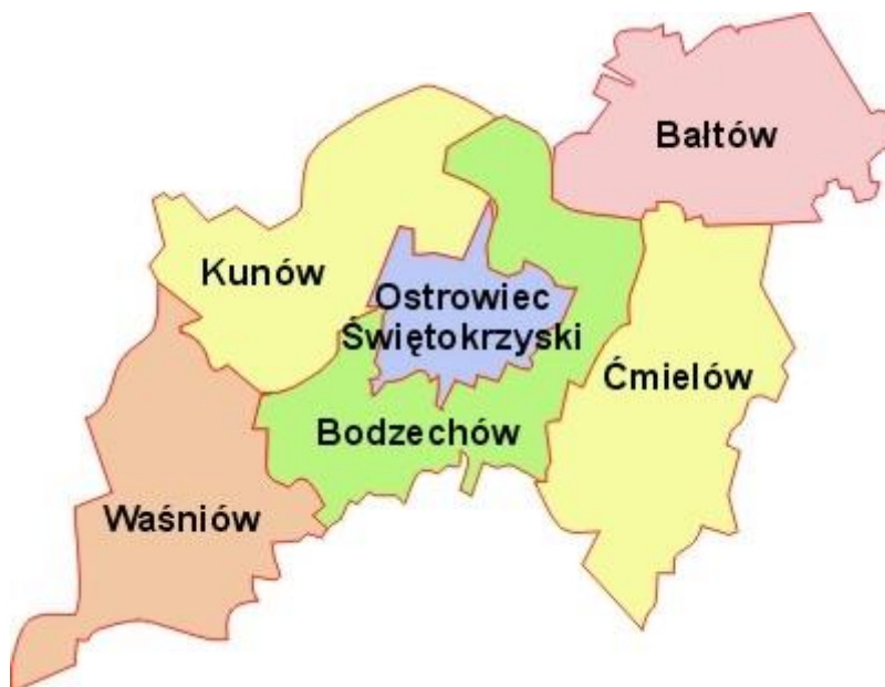
Rysunek 3. Położenie gminy Waśniów na tle powiatu ostrowieckiego.

Pod względem zajmowanej powierzchni Gmina Waśniów jest na czwartym miejscu wśród sześciu gmin powiatu ostrowieckiego. Zgodnie z podziałem fizyczno-geograficznym Polski wg podziału Kondrackiego, Gmina Waśniów położona jest w makroregionie Wyżyny Kieleckiej w obrębie mezoregionów: Wyżyna Sandomierska (Opatowska) i Góry Świętokrzyskie.