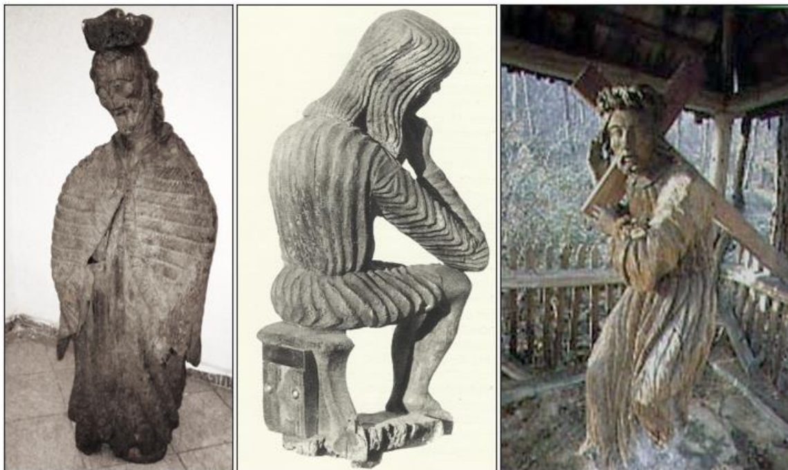
Fotografia 2. Obiekty rzeźby ludowej z terenu gminy Waśniów.

Wykaz obiektów ujętych w Rejestrze Zabytków Ruchomych, przedstawiono w poniższej tabeli.