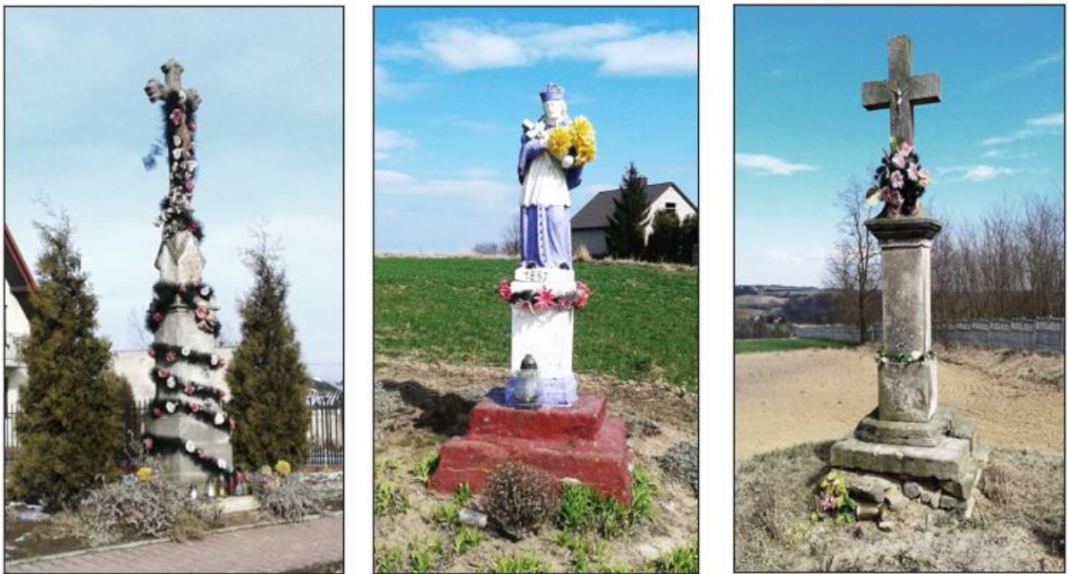
Fotografia 1. Przykłady figur i kapliczek przydrożnych na terenie gminy Waśniów.

Krzyże i figury zaopatrzone są w epigramy, zazwyczaj o charakterze wotywnym, choć często spotyka się inskrypcje odwołujące się do bożej opieki, lub rymowane sentencje modlitewne stanowiące ważny element kultury ludowej. Zły stan zachowania inskrypcji utrudniający ich odczytanie jest wynikiem nie tyle naturalnej erozji kamienia, co częstym malowaniem trwałymi farbami, które łącząc się z kamienną strukturą spowodowały jej łuszczenie i ubytki.