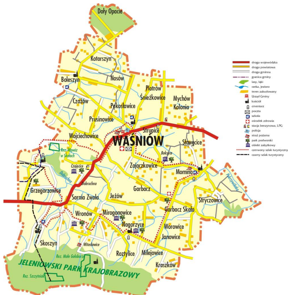
Rysunek 2. Granice administracyjne Gminy Waśniów.

Gmina Waśniów jest gminą wiejską, położoną w północno-wschodniej części województwa świętokrzyskiego i w zachodniej części powiatu ostrowieckiego. Zajmuje obszar 112 km 2 (11 162 ha), co stanowi 18,15% obszaru powiatu ostrowieckiego.